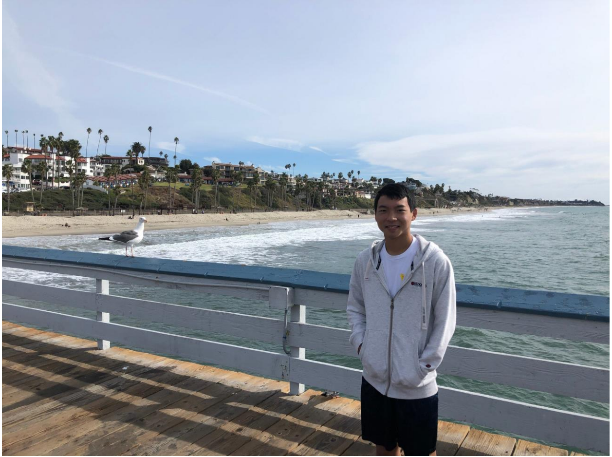
カリフォルニア ( California )